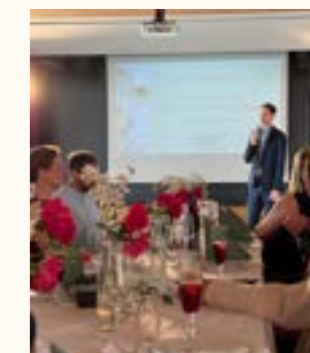
Vorstellung der Projekte

So wurde das Sommerfest zu einem Abend, an dem Förderer, Engagierte und Projektverantwortliche miteinander ins Gespräch kamen – und sichtbar wurde, was möglich ist, wenn gute Ideen, erfahrene Begleitung, finanzielle Unterstützung und Menschen mit Herz zusammenfinden.